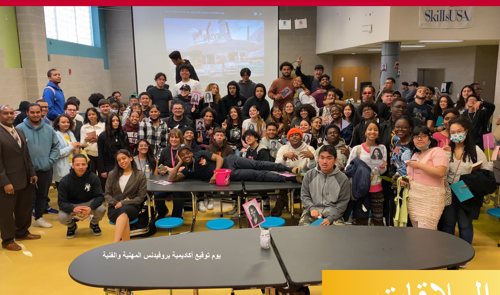
يوم توعية أكاديمية بروفيندس المهنية والفنية